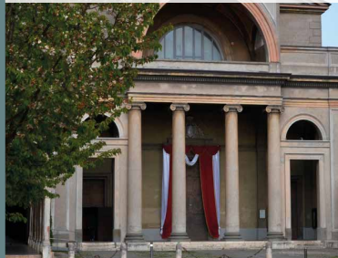
ALBINO Chiesa Prepositurale di S. Giuliano