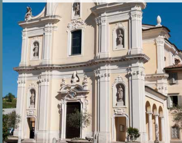
CENATE SOTTO Chiesa Prep. di S. Martino Vescovo