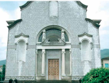
CORNALE DI PRADALUNGA Chiesa Parrocchiale S. Lucia