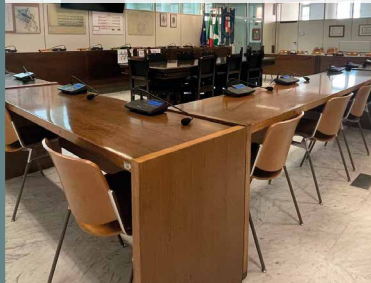
ALBINO Sala consiliare del comune