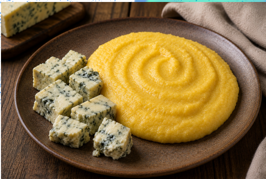
POLENTA E GORGONZOLA