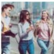
Europa e Mondo