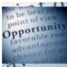
Bandi e Opportunità