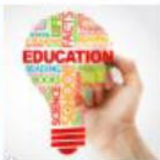
Istruzione e Formazione