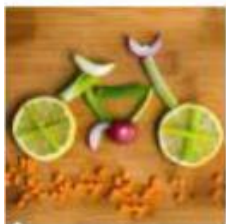
Sport e Benessere